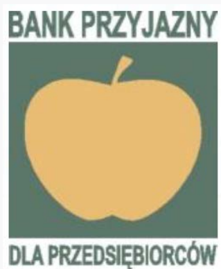
Bank Przyjazny dla Przedsiębiorców 2004-2014